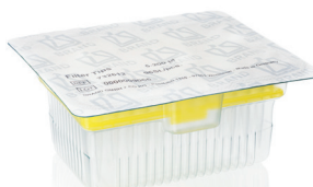
Fig. TipRack (pack de recharge)