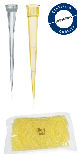
Fig. Pointes de pipettes en vrac dans un sachet